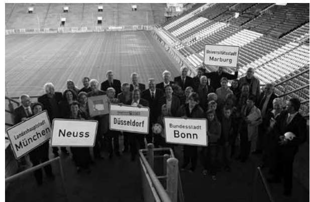
Die Servicestelle Kommunen in der Einen Welt vergibt seit 2003 alle zwei Jahre den Titel „Hauptstadt des Fairen Handels“