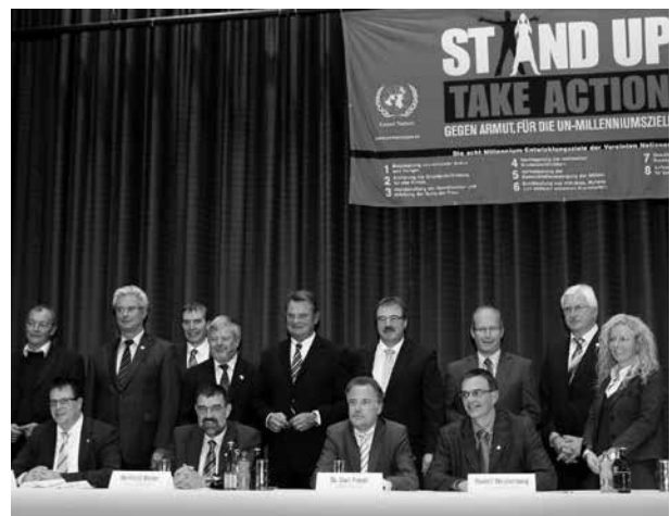
Bürgermeister von elf Kommunen im Kreis Euskirchen unterzeichneten am 31. Oktober 2009 die Millennium-Erklärung der Mitgliedskommunen des Deutschen Städte- und Gemeindebundes

Eckpunkte für eine nachhaltige Entwicklung in Kommunen. 7 Eingebunden in die speziellen Handlungsfelder der Länder sehen die Ministerpräsidenten der Länder den kommunalen Beitrag insbesondere in der Kultur- und Bildungsarbeit, der Kooperation mit Migranten aus Entwicklungsländern, den Bereichen guter Regierungsführung und Dezentralisierung sowie im „Capacity Building“ hinsichtlich der Bereitstellung öffentlicher Dienstleistungen. 8