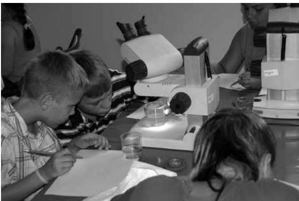
Kinder untersuchen Wasserproben im „Grünen Klassenzimmer“, einem offiziellen Projekt der UN-Dekade „Bildung für nachhaltige Entwicklung“ in Bad Rappenau

Für eine Auszeichnung als Stadt, Gemeinde oder Landkreis der Weltdekade „Bildung für nachhaltige Entwicklung“ müssen die Aktivitäten Ihrer Kommune bezüglich der genannten Kriterien im Vergleich mit anderen Kommunen stark überdurchschnittlich ausfallen.