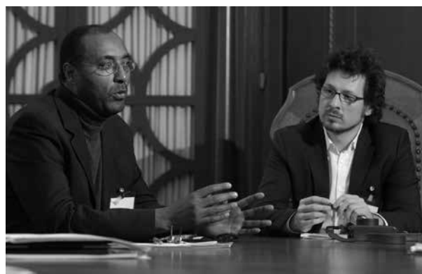
Migranten können als Vermittler, Berater und Experte vor Ort dienen

Das breite Engagement für Herkunfts- wie Aufnahmeland macht Menschen mit Migrationshintergrund zu Partnern der deutschen Entwicklungspolitik. Durch eine stärkere Einbeziehung von Migranten und deren Organisationen vor Ort kann dieses Engagement auch in der Kommunalen Entwicklungspolitik verstärkt genutzt werden.