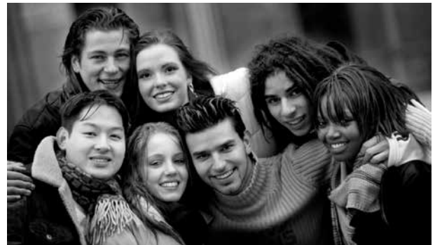
Etwa ein Fünftel der in Deutschland lebenden Menschen sind zugewandert oder Nachkommen von Zuwanderern

Migranten sind „Experten zwischen den Welten“. Schon aufgrund ihrer Biografie können sie als Vermittler, Berater und Experte vor Ort dienen. Dies kommt den Migrantenorganisationen zugute, denn diese unterhalten vielfältige Beziehungen zu ihren Herkunftsländern. Das Engagement der Diaspora zielt unter anderem auf so unterschiedliche Bereiche wie Bildung, Gesundheitswesen, „Community Empowerment“, Wirtschaftsförderung, Friedensarbeit, Umweltschutz, Antikorruption und Infrastruktur. Sie unterstützen etwa Initiativen von dörflichen Vereinigungen im Bereich Gesundheit oder Bildung, regen neue Ideen im Bereich Ausbildung oder Umweltschutz an oder verschreiben sich bestimmten professionellen Zielen, wie dem Transfer von Know-how auf Hochschulebene. 68 Daraus ergeben sich viele gemeinsame Ziele mit der deutschen Entwicklungszusammenarbeit, allen voran das Ziel der Armutsbekämpfung.