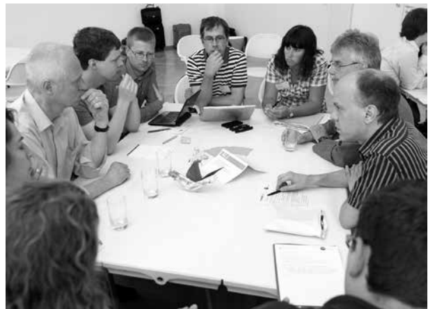
Mit dem Bürgerhaushalt hält eine neue Kultur der Einbeziehung und Beteiligung von Bürgerinnen und Bürger Einzug in die Kommunen

Verwaltungsmitarbeiter erfahren, dass Bürgerbeteiligung der Verwaltung trotz anfänglicher Mehrarbeit nutzt. Durch mehr Entscheidungsklarheit, zunehmende Bürgerzufriedenheit und generelles bürgerliches Empowerment kann ein Bürgerhaushalt die Verwaltung langfristig sogar nachhaltig entlasten. Außerdem hilft der Bürgerhaushalt bei der Modernisierung der Verwaltung, die immer stärker auf themenübergreifende Zusammenarbeit und Lösungsentwicklung zielt.