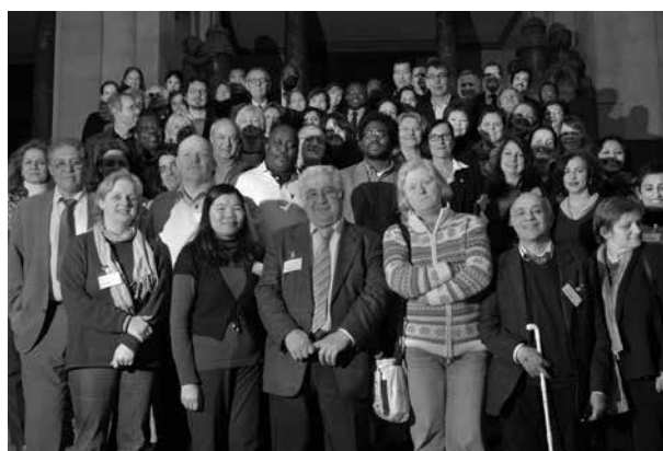
Die Servicestelle Kommunen in der Einen Welt fördert die Vernetzung von Entwicklung und Migration durch einen bundesweiten Erfahrungsaustausch

Die Servicestelle Kommunen in der Einen Welt (SKEW) hat 2011 das bundesweite Netzwerk „Migration und Entwicklung“ ins Leben gerufen. Das Netzwerk ist ein wichtiges Instrument zum bundesweiten Erfahrungsaustausch und der Vernetzung von Entwicklung und Migration für die lokale Ebene. Es bringt Akteure aus Kommunalverwaltung und Zivilgesellschaft miteinander ins Gespräch und bietet ihnen ein Forum für einen kollegialen Austausch zu praxistauglichen Ideen, Handlungsansätzen und Projekten. Im Sinne einer Lerngemeinschaft werden neben guten Beispielen auch Hürden in der Alltagspraxis und erfolgreiche Ansätze zur Problemlösung diskutiert. Auch Schnittstellen zur staatlichen Entwicklungszusammenarbeit und zur Arbeit anderer maßgeblicher Akteure werden aufgezeigt. Darüber hinaus stellt die SKEW der kommunalen Ebene Informationen zu relevanten Erfahrungen, Beispielen und Akteuren zur Verfügung. Sie bietet kostenlose Beratung und Qualifizierung an. www.service-eine-welt.de/interkultur/interkultur-start.html