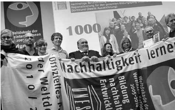
Bereits im März 2010 zeichnete die Deutsche UNESCO-Kommission mit dem Karl-Schiller-Berufskolleg Dortmund das 1.000. UN-Dekade-Projekt in Deutschland aus - Foto: DUK/ Studnar

Als politischer Orientierungsrahmen dient das Leitbild einer nachhaltigen Entwicklung wie es auf der Umweltkonferenz von Rio de Janeiro 1992 in der „Agenda 21“ formuliert wurde. 63 Dieses Leitbild steht „gleichermaßen für wirtschaftliche Leistungsfähigkeit, soziale Gerechtigkeit, ökologische Tragfähigkeit und gute Regierungsführung“ 64 . Die Geltung des Leitbildes wurde von der Weltgemeinschaft zuletzt anlässlich der Rio+20-Konferenz in Rio de Janeiro im Juni 2012 bekräftigt. Als zentrale weltgesellschaftliche Aufgaben stehen die Bewahrung der natürlichen Lebensgrundlagen und der Abbau der sozialen Ungleichgewichte zwischen Reich und Arm im Vordergrund sowie insbesondere die Beschlüsse zur UN-Dekade für nachhaltige Entwicklung (2005 bis 2014) und der entsprechende deutsche Aktionsplan.