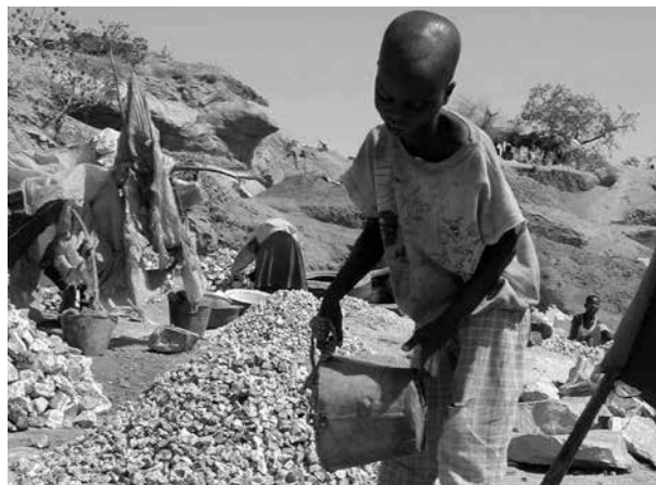
Mit ihrem Verbot von Natur- und Grabsteinen aus ausbeuterischer Kinderarbeit auf Friedhöfen ist die Stadt Saarbrücken Vorreiter

Mittlerweile stammen 80 Prozent der in Deutschland verkauften Grab- und Natursteine aus Indien, China und Vietnam. Der Grund: Viele regionale Steinbrüche sind aus ökologischen Gründen stillgelegt und die Steine aus Asien sind billig zu haben. In den Steinbrüchen Indiens, Chinas oder Vietnams herrschen Arbeitsbedingungen, die weit unter den europäischen Standards liegen. Auch viele Kinder arbeiten dort unter schwersten Bedingungen mindestens zwölf Stunden am Tag und gegen wenig Bezahlung, oft auch ganz ohne Lohn. Die Lebenserwartung liegt bei rund 38 Jahren.