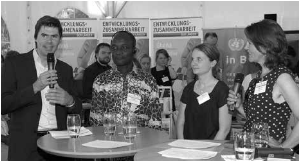
Im Rahmen des Projektes „50 Kommunale Klimapartnerschaften bis 2015“ tauschen sich deutsche und afrikanische Kommunen im Bereich Klimaschutz und Klimaanpassung aus

rungsführung und dezentrale Steuerung schaffen Sicherheit und Entwicklung.