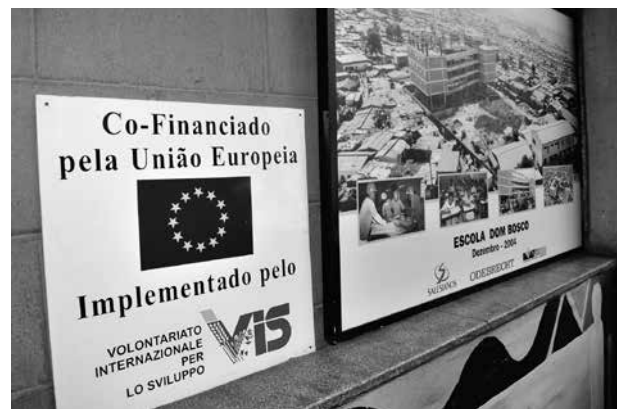
Die Europäische Union fördert über eine Reihe von Förderprogrammen auch Projekte der Kommunalen Entwicklungspolitik - Foto: Europäische Kommission

ausgerichtet sind 53 , die Entwicklungspolitik der Städte, Gemeinden und Regionen. Die Schwerpunkte der EU-Förderung liegen in den Bereichen Verwaltungsreform, Wirtschaftsförderung, nachhaltige Gesundheits- und Sozialversorgung, Städteplanung und Umwelt. Die Förderung stellt dabei stets eine Ko-Finanzierung dar, durch die 50 bis maximal 75 Prozent der Projektkosten gedeckt werden.