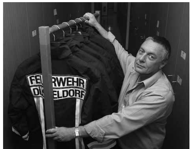
Bereits im Jahr 2001 stieg die Feuerwehr der Stadt Düsseldorf auf fair gehandelte Dienstkleidung um

Wenn ein öffentlicher Auftraggeber Kaffee oder Obst aus Fairem Handel beschaffen möchte, kann er in den Vertrags-erfüllungsklauseln des Beschaffungsauftrags von Lieferanten verlangen, dass dieser den Erzeugern einen Preis zahlt, der ihre Kosten für nachhaltige Erzeugung deckt. Dazu gehören etwa angemessene Löhne und menschenwürdige Arbeitsbedingungen sowie umweltfreundliche Produktionsmethoden.