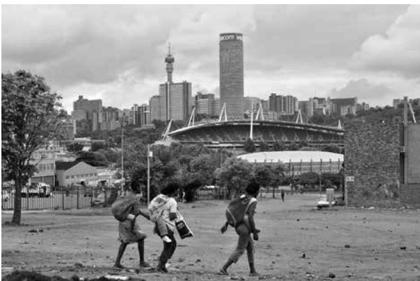
Als Ausrichter der Fußball-WM 2010 sollte Südafrika von den Erfahrungen der Fußball-WM 2006 in Deutschland profitieren

Der Erfolg der deutschen WM 2006 basierte zum Großteil auf den von der Außenwelt kaum wahrgenommenen Anstrengungen der WM-Austragungs- und Teamstädte: Verkehrslenkung, Stadienbau und -sicherheit, Fanmeilen, das Umweltprogramm „Green-Goal“, Marketing und die Zusammenarbeit mit den Tourismusverbänden – all das und vieles mehr hatte den glanzvollen Auftritt der WM überhaupt erst ermöglicht.