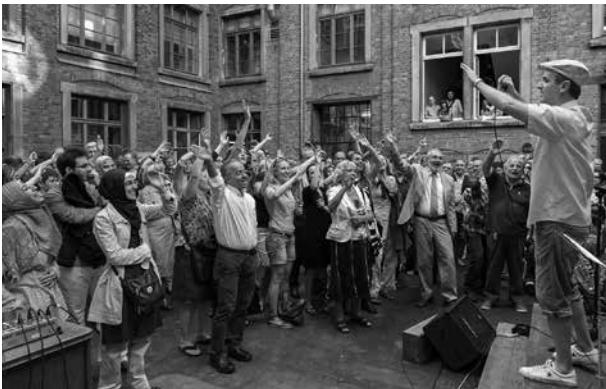
Mit einem großen Eröffnungsfest ist am 24. Juli 2012 in Heidelberg das „Interkulturelle Zentrum in Gründung (IZiG)“ eröffnet worden

Im Rahmen der Konzeptstudie der Stadt Heidelberg wurde eine Umfrage mit über 60 Migrantenorganisationen in Heidelberg durchgeführt. 84 Prozent der Befragten formulierten einen Bedarf an Räumlichkeiten. Darüber hinaus wurden acht interkulturelle Zentren im deutschsprachigen Raum kontaktiert und ihre unterschiedlichen inhaltlichen und formalen Ansätze hinsichtlich Leistungsangebot, Trägerschaft, Struktur und Finanzierung ausgewertet. Die Erarbeitung und Diskussion von konkreten Realisierungsvarianten räumlicher und finanzieller Art ist ein zentraler Teil der Studie. Von einer Komplett-Realisierung über die Anmietung oder den Kauf einer kleinen Immobilie als Zwischenlösung bis hin zu einer Nutzbarmachung bereits vorhandener Räumlichkeiten wurde vieles durchdacht, wobei die Zwischenlösung, welche die Miete eines größeren Objekts beinhaltet (als „Variante 2b“ bezeichnet), präferiert wurde. Diese Variante konnte mit einem überschaubaren Finanzbedarf kurzfristig umgesetzt werden. Das mittelfristige Ziel ist der Bau oder Kauf einer Immobilie, die den Bedarf an Räumlichkeiten vollständig abdeckt.