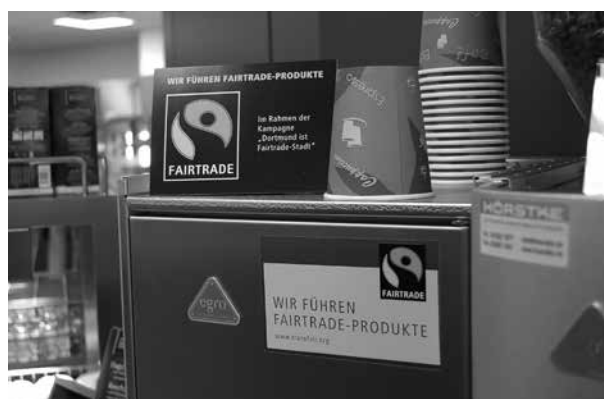
Immer mehr Kommunen gehen mit gutem Beispiel voran und bieten in ihren Rathauskantinen fair gehandelte Speisen und Getränke an - Foto: Stadt Dortmund

Damit aus kommunalem „Einkauf“ eine „Faire Beschaffung“ wird, können verschiedene Kriterien ganz oder teilweise bei den kommunalen Ausschreibungen berücksichtigt werden. Als wesentlichstes Kriterium gilt die Einhaltung der sogenannten ILO-Kernarbeitsnormen . 28 Basierend auf den vier Grundprinzipien der Internationalen Arbeitsorganisation (International Labour Organisation/ILO) „Vereinigungsfreiheit und Recht auf Kollektivverhandlungen“, „Beseitigung von Zwangsarbeit“, „Abschaffung der Kinderarbeit“ und „Verbot der Diskriminierung in Beschäftigung und Beruf“ sind acht Übereinkommen getroffen worden, die als Kernarbeitsnormen bezeichnet werden: