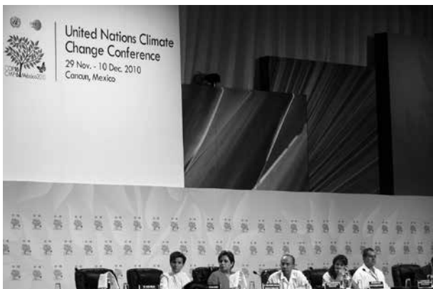
Bei der UN-Weltklimakonferenz Ende 2009 in Cancún wurden die Kommunen als zentrale Akteure bei der Anpassung an den Klimawandel bezeichnet

Entwicklungspolitik für die Kommunen: „Dem Beitrag der Kommunen für die Partnerschaft mit Entwicklungsländern messen die Länder eine große Bedeutung zu. Dies gilt insbesondere für Kultur- und Bildungsarbeit, für die Kooperation mit Migrantinnen und Migranten aus Entwicklungsländern, für gute Regierungsführung und Dezentralisierung sowie für ‚capacity building‘ im Bereich kommunaler Aufgaben.“