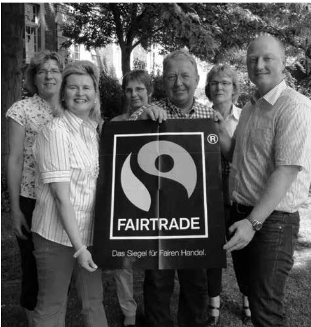
Das von der unabhängigen Initiative TransFair e. V. vergebene Fairtrade-Siegel ist mittlerweile ein Markenzeichen für fair gehandelte Produkte

Die Stadt Düsseldorf verzichtet bei der Beschaffung nicht nur auf Produkte aus ausbeuterischer Kinderarbeit, sondern fordert auch die Einhaltung aller acht ILO-Kernarbeitsnormen. Die Liste der fair angeschafften Produkte der Stadt ist lang und reicht von fair produzierter Feuerwehrkleidung, „fairen Uniformen“ des Ordnungs- und Servicedienstes und ILO-gerechter Kleidung für die Mitarbeiter des Gartenamtes über faire Blumen und FSC-zertifiziertes Holz bis hin zu fairen Fußballen. 32